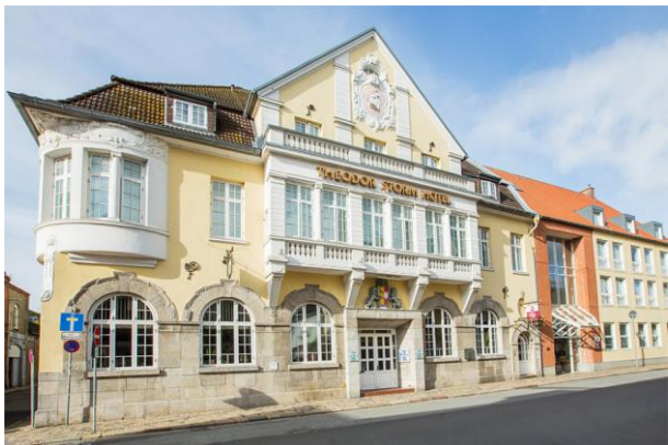
Best Western "Theodor-Storm-Hotel"

Ausgangspunkt der Tour sind das Theodor-Storm Hotel und das Nordseehotel Hinrichsen. Beide Hotels befinden sich in der Innenstadt von Husum und sind in der Nähe des Husumer Schlosses.