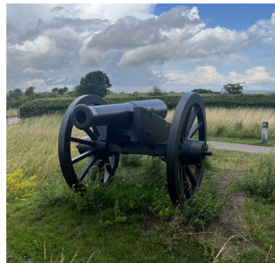
Düppeln – Schanzen und Museum