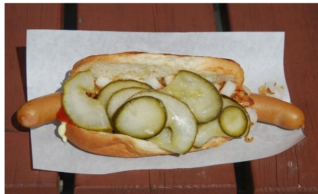
Hot Dog Made in Dänemark

Danach fahren wir weiter nach Broager und Düppel. In Düppeln fand im Krieg vom 1864 (also vor 160 Jahren) die entscheidende Schlacht im deutsch-dänischen Krieg statt.