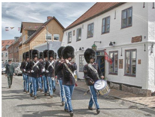
Den Gamle Kro

Über Grasten, wo eine Pause im historischen „Den Gamle Kro“ mit einem leckeren dänischen Imbiss geplant ist, geht die Tour zum Schloss Gravenstein mit seinem wunderschönen Garten. Dort weilt auch die dänische Königin regelmäßig.