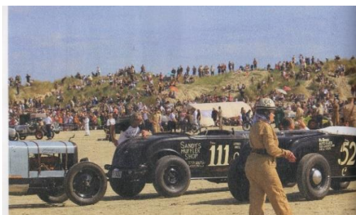
Oldtimerfestival am Strand

Von Tondern fahren wir über den Römö-Damm bis Hanneby. Dort erwartet uns ein leckerer Imbiss. Im Anschluss daran geht die Fahrt an den riesigen Strand in Römö. Dort dürfen Autos fahren und dort findet jedes Jahr am Strand ein Motor-Festival mit mehr als 30.000 Zuschauern und Teilnehmern aus ganz Europa und ihren Oldtimern statt, die alle vor 1947 gebaut sein müssen.